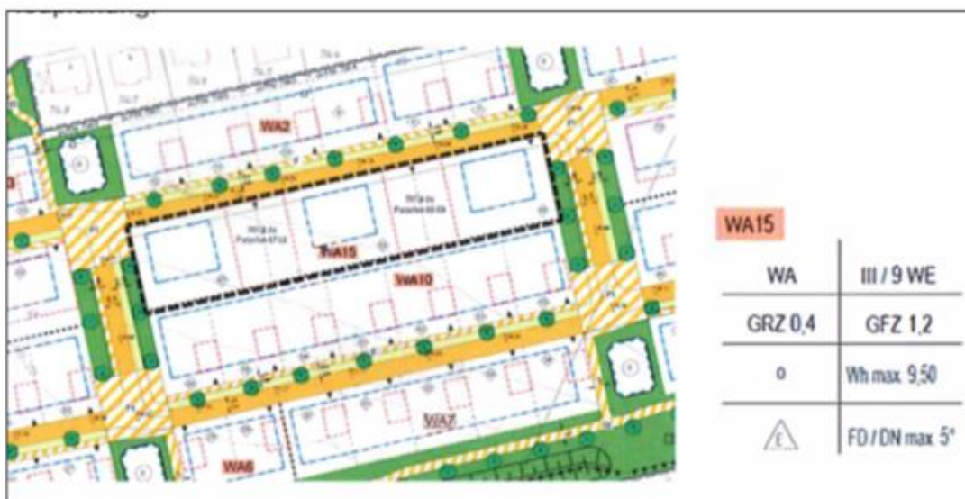
Neuplanung: Darstellung der geplanten drei Mehrfamilienhäuser